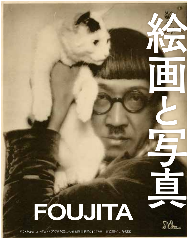
ドラ・カームス(マダム・ドラ)《猫を肩にのせる藤田嗣治》1927年 東京藝術大学所蔵