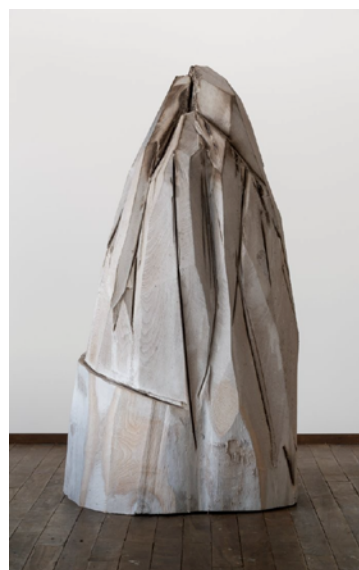
国松希根太《GLACIER MOUNTAIN》2022年 木（ミズナラ）にアクリル絵具