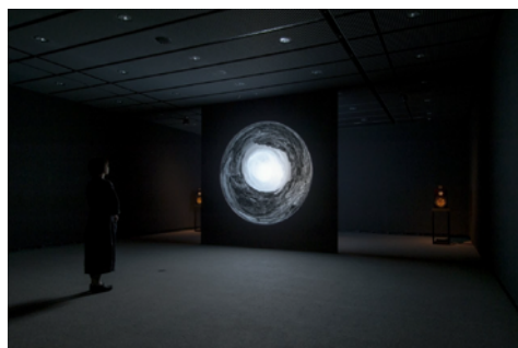
平川紀道《sunlight spectrum sonification》2022年 コンピューター、DLP プロジェクター、スピーカー、 オーディオ・インターフェース