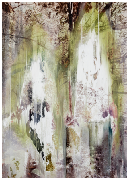
池田光弘《untitled (figure no.11)》2024年 油彩、キャンヴァス