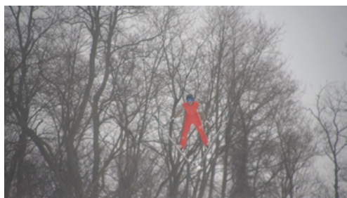
野口里佳《雪の音》2025年 シングルチャンネル・ビデオ、サウンド