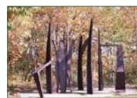
《日暮れ時の街 No.9》 野外美術館