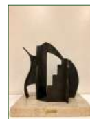
《アラベスクな街》 芸術の森センター