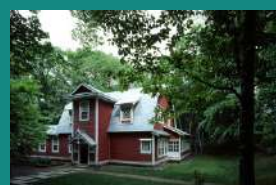
有島 武郎 (ありしま たけお) 旧邸