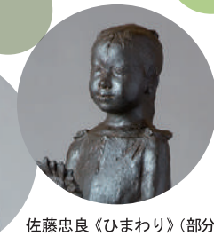
佐藤忠良《ひまわり》(部分)