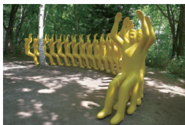
福田繁雄《椅子になって休もう》